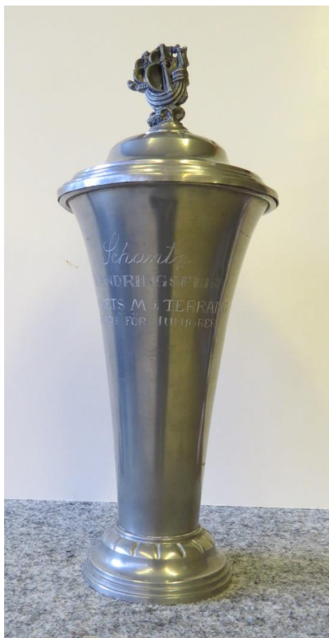
Schantz VANDRINGSPRIS KRETS M i TERRÄNG LAGPRIS FÖR JUNIORER

Schantz's vandringspris i Kretsmästerskapet (Enköpingstraktens lag) för juniorlag i terränglöpning sattes upp 1944. Tre in-teckningar innebar att man vann priset för alltid. Det blev Wilö som vann sin tredje in-teckning och därmed tog hem priset för alltid år 1951. Inga uppgifter har hittats ännu om vilka som deltog i Wilös lag detta år.