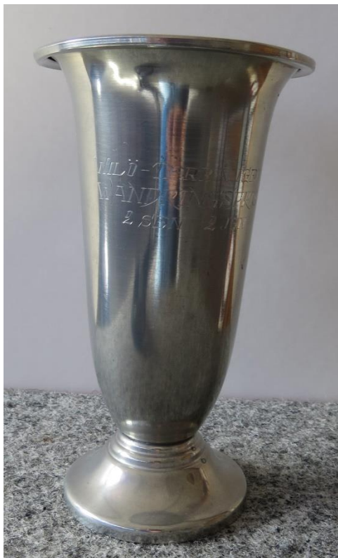
WILÖ-TERRÄNGEN WANDRINGSPRIS 2 SEN 2 JUN