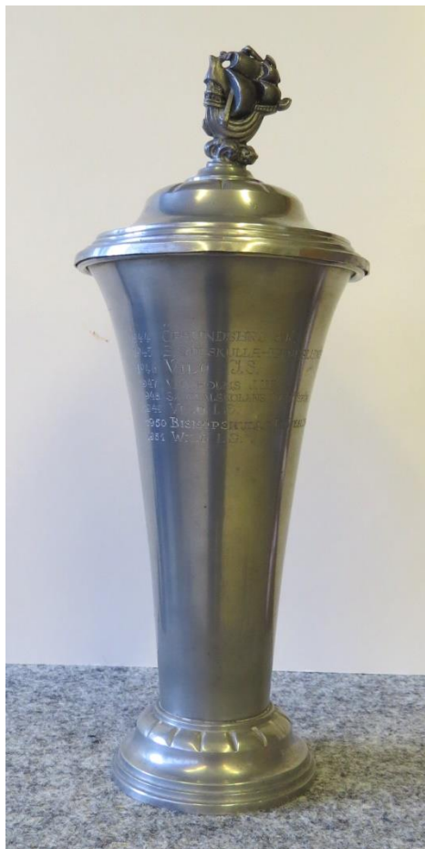
1944 Örsundsbro SK 1945 Biskopskulla - Fröjeslunda JUF 1946 Vilö IS 1947 Veckholms JUF 1948 Samrealskolans Idrottsför. 1949 Vilö IS 1950 Biskopskulla - Fröjeslunda JUF 1951 Wilö IS

Söndagen den 29 april 1951, Wilöterrängen.