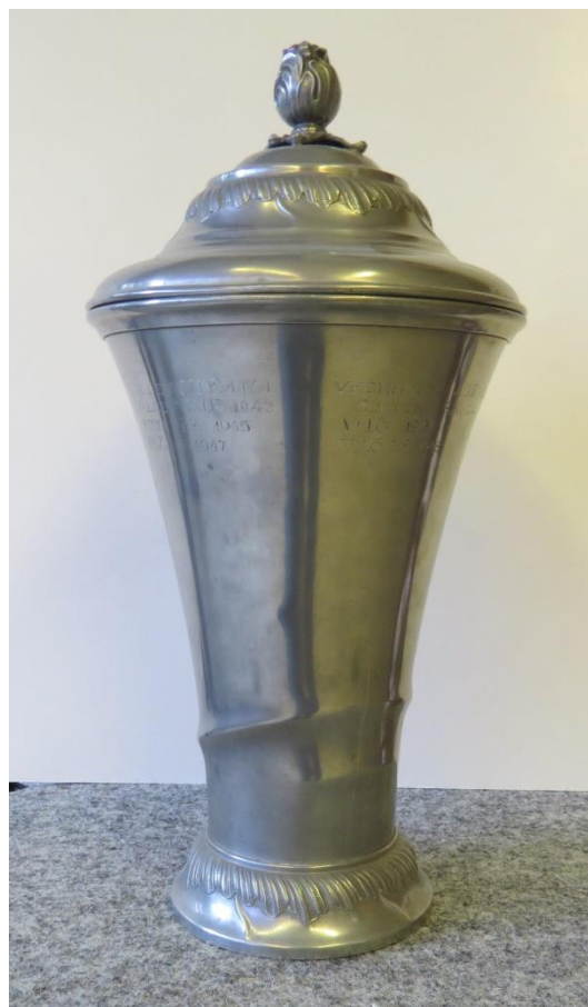
Vallby JUF 1941 Veckholms JUF 1942 Vallby JUF 1943 Simtuna SK 1944 Fittja IF 1945 Vilö IS 1946 Vilö IS 1947 Vilö IS 1948

Den 25 april 1948 arrangerades åter den årliga Wilöterrängen vid Hässelbygården. Wilö hade många löpare med.