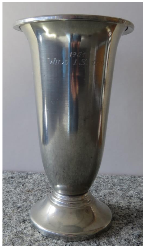
1951 WILÖ IS 12 P