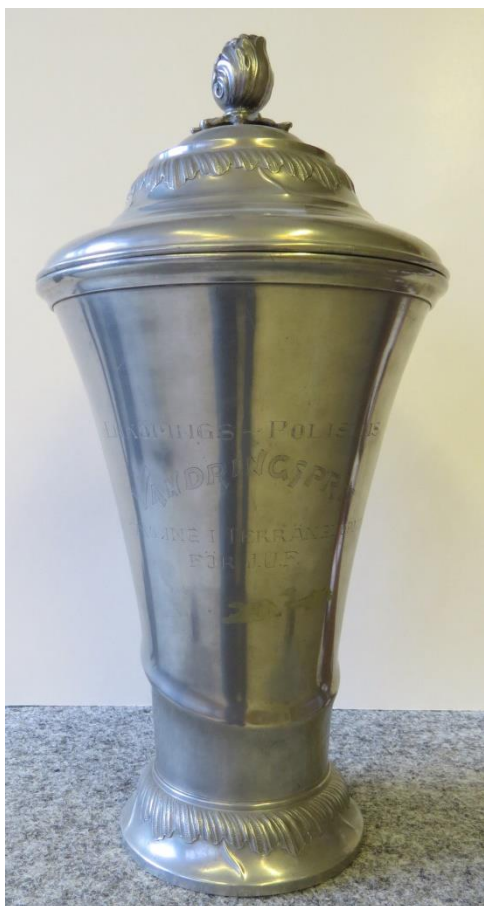
Enköpings-Polisens Vandringspris Lagtävling i Terränglöpning För JUF